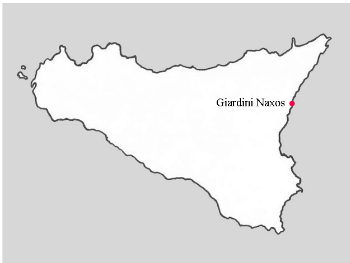
Fig. 4. Carta della Sicilia con il centro di Giardini Naxos (elaborazione grafica V. Magro).

produzione ionica e cicladica, il rinvenimento di armi votive – punte di lancia e lame di pugnali –, presso l’area sacra collocata nell’estremità sud-occidentale della città, fanno presumibilmente supporre che qui fosse tributato un culto ad Era Hoplosmia , mentre la scoperta di statuette fittili raffiguranti offerenti recanti colombe o melagrane ha fatto ipotizzare che fosse presente, per via di questi attributi, anche un sacello dedicato ad Afrodite, richiamando a sua volta il racconto di Appiano 9 .