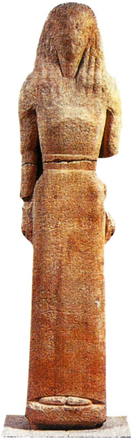
Fig. 1. Atene, Museo, Kore di Nikandre (da ZUFFI 2016).